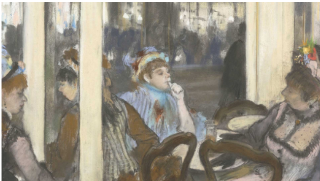
Moterys kavinės terasoje vakare (1877), dail. Edgaras Dega, Edgar Degas (1834 - 1917).