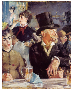
Kavinėje-koncerte (1879), dail. Édouard Manet (1832 - 1883).