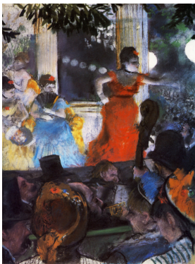
Koncertas kavinėje (1887), dail. Edgaras Dega, Edgar Degas (1834 - 1917).

To meto miestiečiai mėgo praleisti laisvalaikį ir linksintis daugybėje kavinių, kuriose dažnai pasirodydavo ir populiarius to meto atlikėjai. Kavinės tapo neatsiejama XIX amžiaus pabaigos meno scenos dalimi, įkvėpusia ne vieną žymų kūrinių. Impresionistai naudodavo šias socialines erdves kaip galimybę stebėti ir užfiksuoti jų gyvenimą, jo dinamiką ir įvairiapusiškumą. Kavinėse vykstantys susitikimai skatino atviras diskusijas apie meną, filosofiją, politiką ir visuomenę, dažnai tapdavo naujų dailės kūrinių, literatūros veikalų, muzikinių kompozicijų ir teatrinų vaidinimų pradžios tašku. Čia, prie kavos puodelio, gimdavo naujos idėjos, eskizai pavirsdavo paveikslais, o atsitiktiniai pokalbiai virsdavo rimtais meniniais projektais.