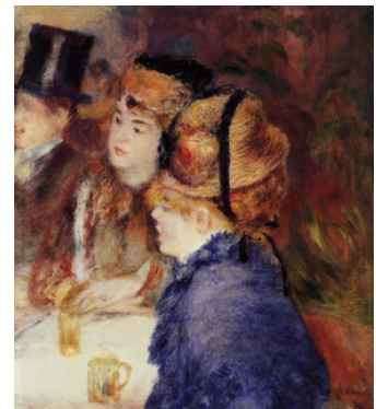
Kavinėje (1877), dail. Pjeras Ogiustas Renuaras, Pierre-Auguste Renoir (1841 - 1919).