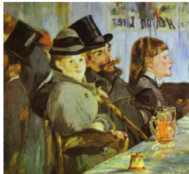
Kavinėje. (1878), dail. Édouard Manet (1832 - 1883).